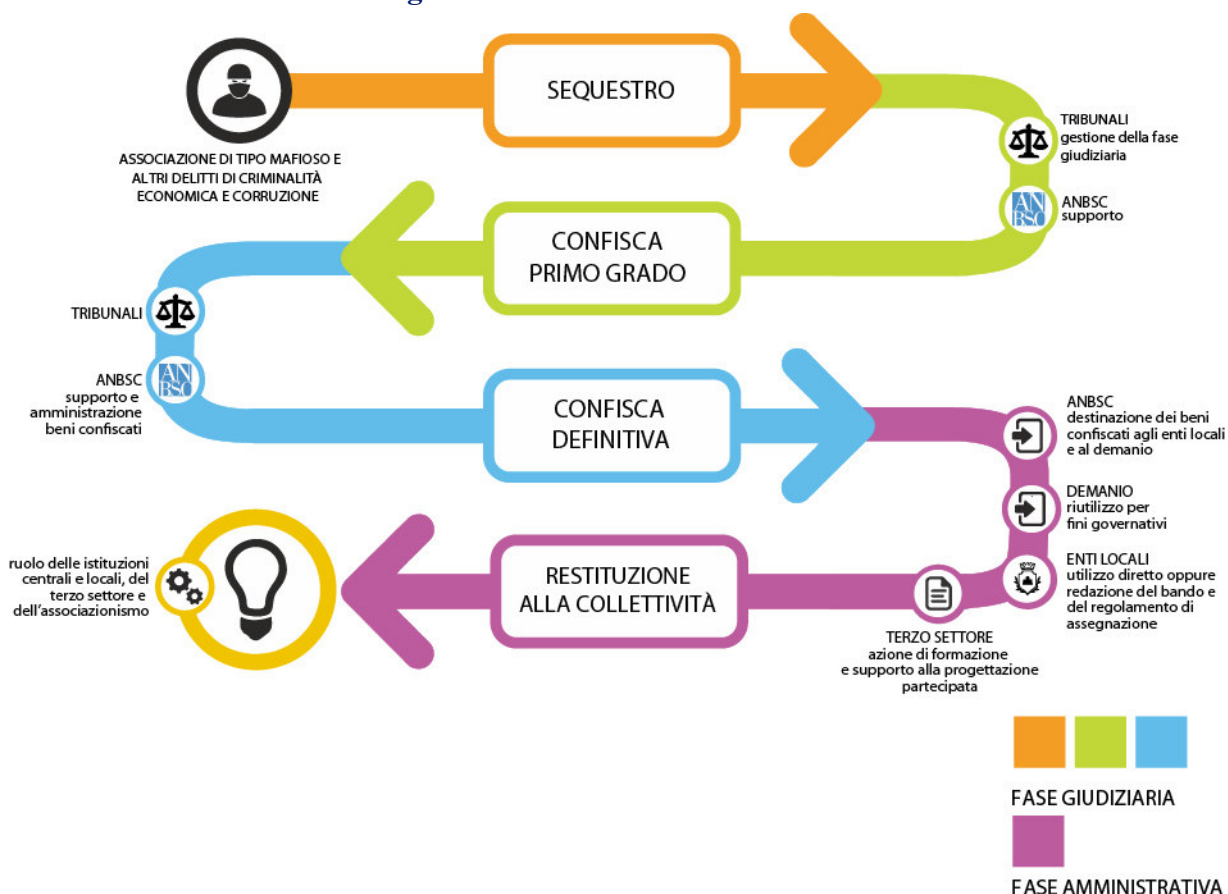
Figura 1 - Processo e attori dell’iter di sequestro, confisca e destinazione dei beni sottratti alla criminalità organizzata

Per la programmazione e attuazione delle politiche di coesione, finanziate da risorse comunitarie e nazionali, l’attuale quadro istituzionale vede il coordinamento del Dipartimento per le Politiche di Coesione della Presidenza del Consiglio dei Ministri (DPCoe) e dell’Agenzia per la Coesione Territoriale (ACT), istituita ai sensi dell’art. 10 del D.L. 31 agosto 2013, n. 101, e il coinvolgimento operativo di tutte le Amministrazioni, centrali e regionali, titolari di Piani e/o Programmi i cui beneficiari possono essere anche Enti e Amministrazioni locali, associazioni, organizzazioni, cooperative, imprese o singoli individui.